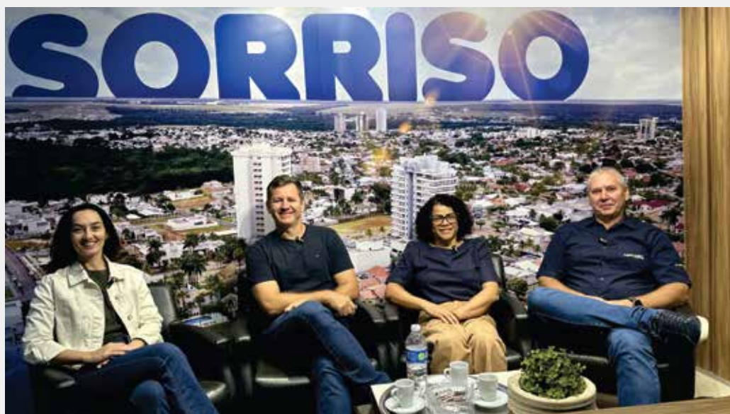
Diretores da CDL Sorriso debatem industrialização e comércio local.