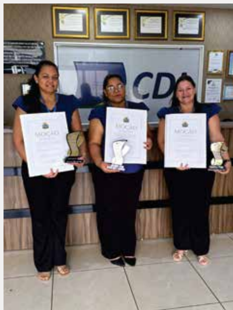
Profissionais da CDL Sorriso recebem homenagem pelos anos de dedicação à entidade e ao fortalecimento do sistema CNDL