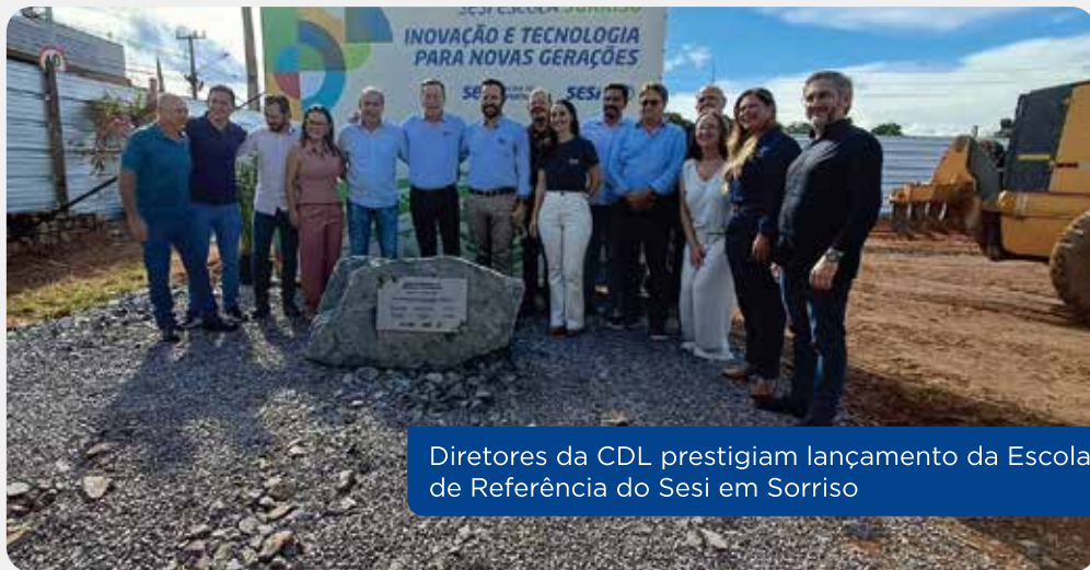
Diretores da CDL prestigiam lançamento da Escola de Referência do Sesi em Sorriso