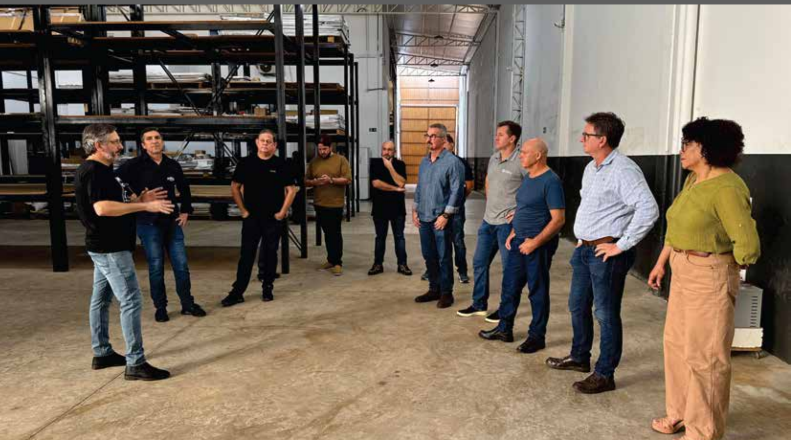
5º Networking Empresarial na Simonetto Móveis Planejados

“A participação dos diretores acompanhando os processos e a organização da empresa proporciona uma rica troca de ideias sobre gerenciamento e gestão de equipe. É uma oportunidade de vivenciar práticas que podem ser levadas para dentro das nossas empresas”, disse.