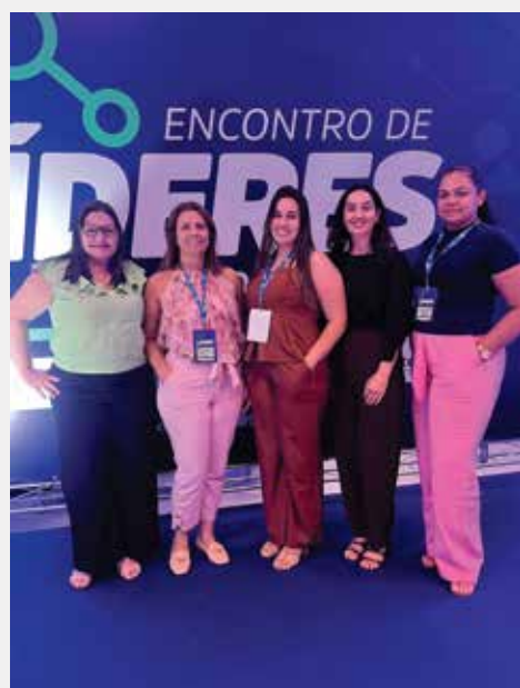
CDL Sorriso marca presença no Encontro de Líderes Rota 2026. A gerente-executiva, diretoras e coordenadoras participam do evento